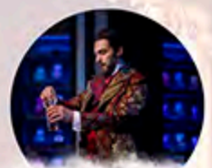
Jekyll és Hyde