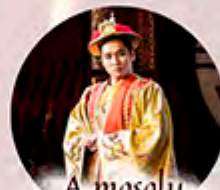
A mosoly országa