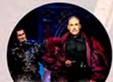
Monte Cristo grófja