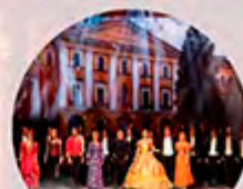
Együtt az Autistákért Gála