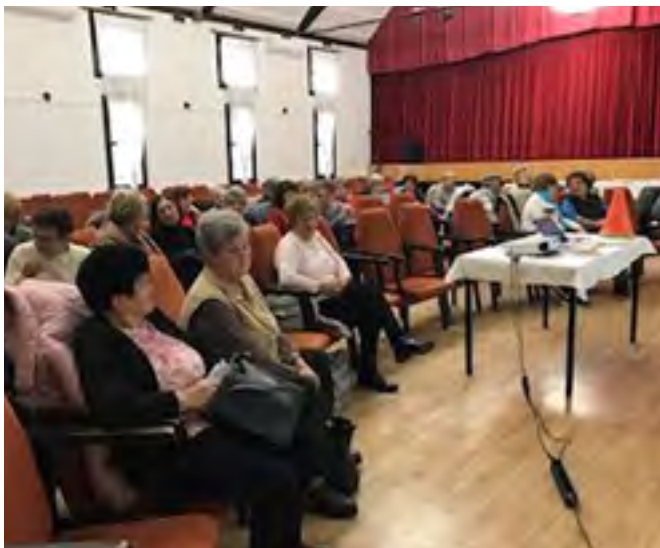
Interaktív előadás Decsen