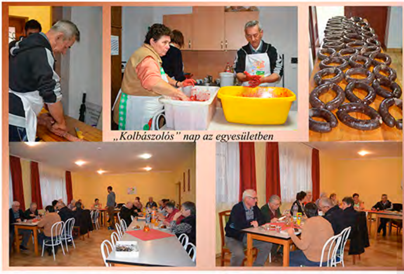
„Kolbászolás” nap az egyesületben